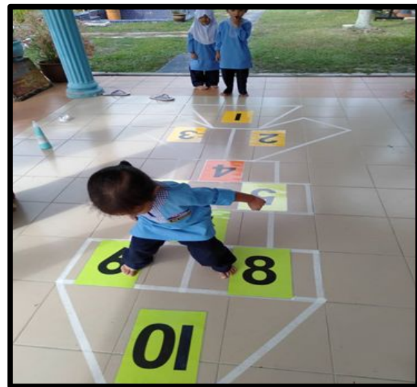
Kanak-kanak memulakan permainan sambil membuat kiraan nombor dengan berhati-hati