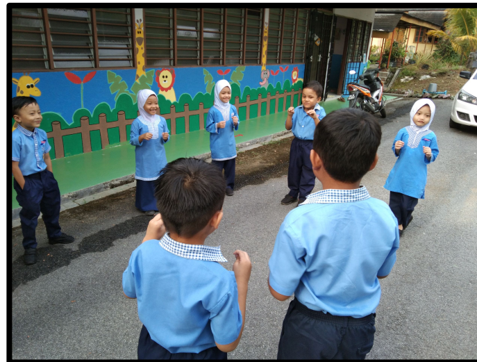
Kanak-kanak membentuk bulatan di luar kelas & melakukan senaman ringan